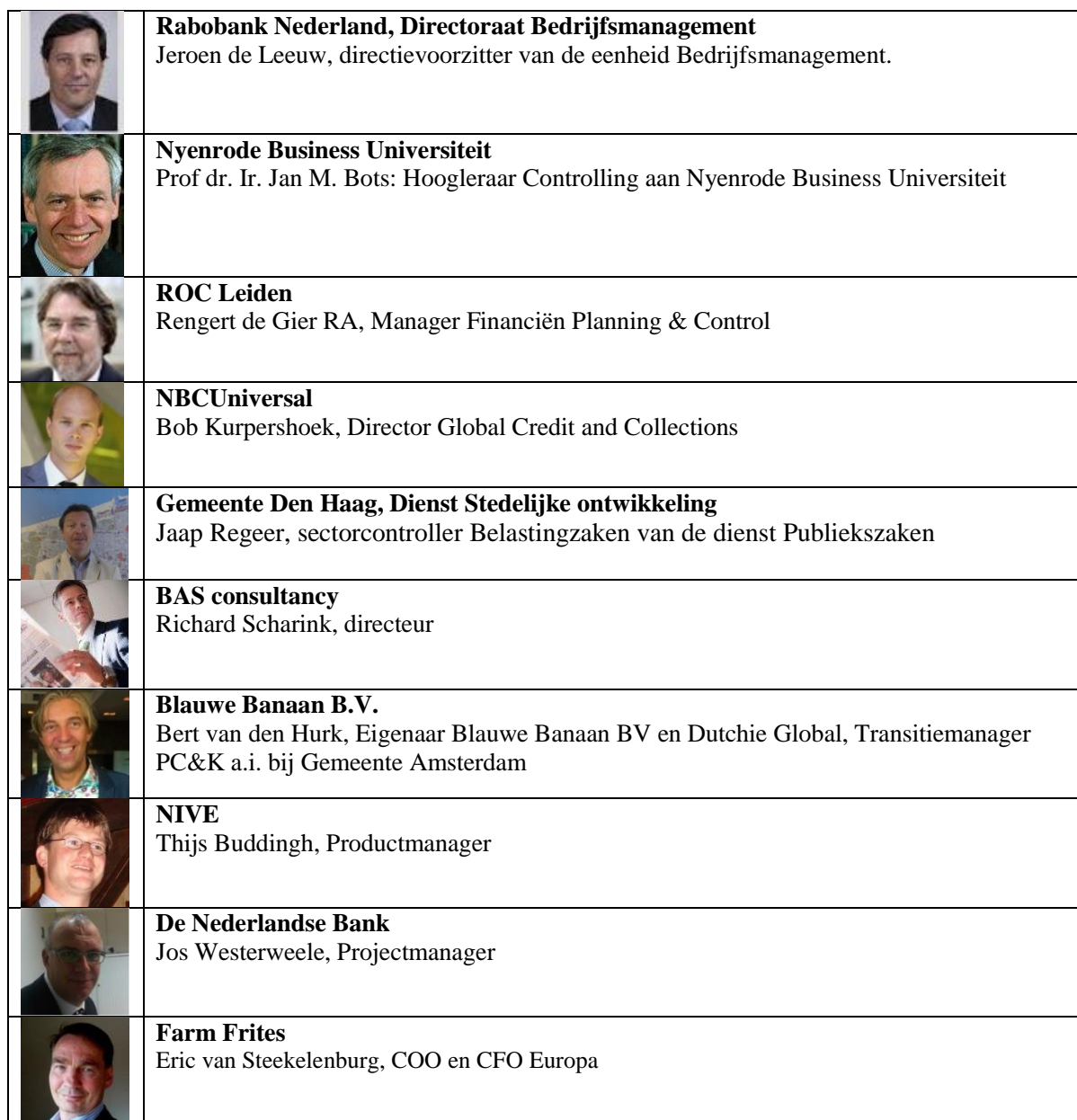
Tabel 5 Raad van Advies werkveldleden