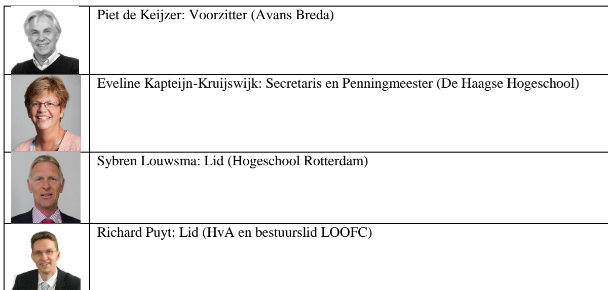
Tabel 6 Raad van Advies LOOFC leden